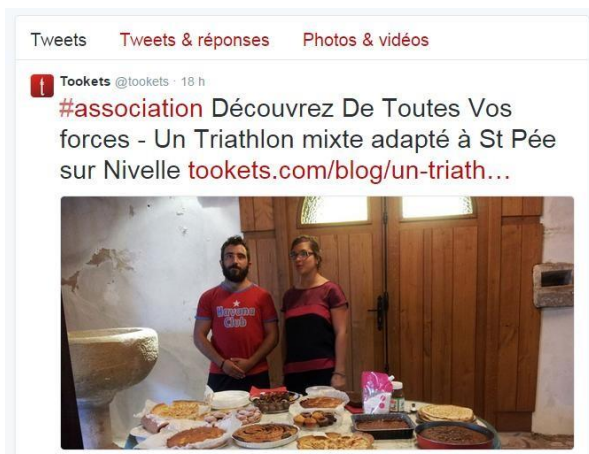
Post sur le compte Twitter de Tookets: faire connaître son association