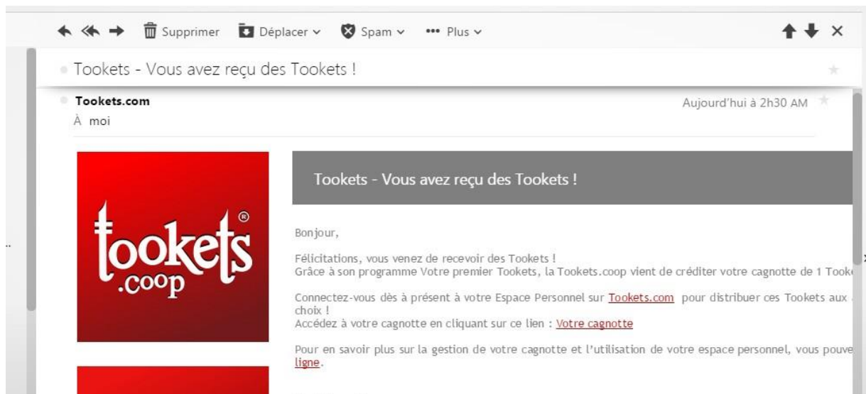
Mail reçu après inscription à Tookets: le particulier reçoit son premier tooket sur sa cagnotte